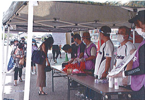
(入場の際の検温、アルコール消毒)